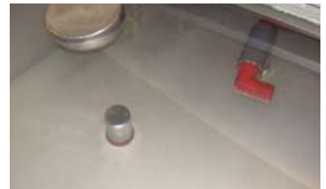
Abb. 2: Feuchtwasserbecken mit WESSO® CLARIS behandelt.