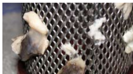
Abb. 3 bis 6: Druckrückstände und Biofilm.