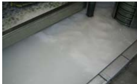
Abb. 1: Feuchtwasserbecken vor dem Einsatz von WESSO® CLARIS.

Im Offset-Druck entsteht im Feuchtwasser-Kreislauf der Druckmaschinen eine hohe mikrobiologische Belastung. Verkeimtes Wasser führt zur Bildung von schmierigen Belägen und kann die Druckqualität und Gesundheit gefährden.